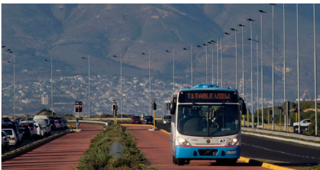
Eksklusiewe bane verminder reistyd.