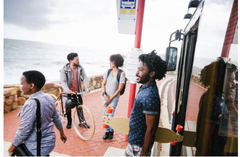
Fase 2A van MyCiTi-dienste sal nuwe maniere skep om by die werk, skool en ontspanningsplekke te kom.

Die Stad Kaapstad het die hoofroete en stasieliggings goedgekeur ná openbare skakeling in 2015. Fase 2A sal nog 'n paar jaar neem voor dit afgehandel is, maar padwerke begin binnekort in Govan Mbeki-weg tussen Jan Smuts-rylaan en Otteryweg.