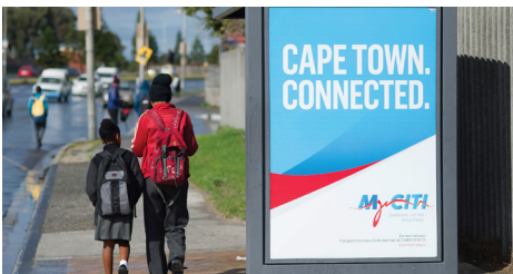
Nuwe sypaadjies en straatligte maak dit veiliger.