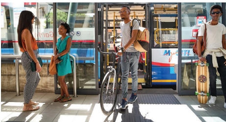
Maklike toegang vir rolstoel, stootwaentjies en fietse.

Die konstruksiewerk vir die projek word grootliks deur die nasionale regering befonds.