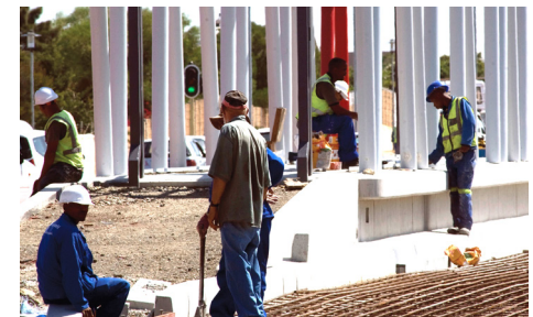
Die werk sal in fases plaasvind en verkeer sal te alle tye voortgaan, maar verkeersdruk word vermag.

Teken aan om meer inligting te kry – sien die agterblad vir die besonderhede.